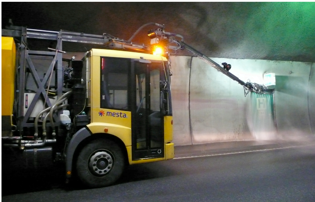
Fig. 3 Tunnelvask

For å ha kontroll med mulig forurensningsspredning ved vask, skal det foretas en vurdering av hvilke miljøfarlige stoffer som finnes og hvilke konsentrasjoner stoffene opptrer i for den enkelte tunnel. Dersom vurderingen gir grunnlag for tiltak, skal dette tas inn i Ytre-miljø-planen (YM-planen) for den aktuelle kontrakten.