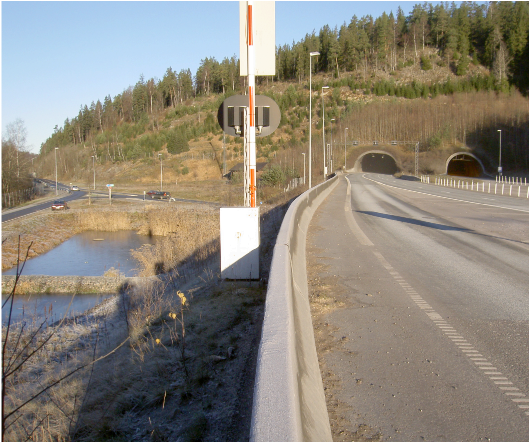
Fig. 2 Sedimentasjonsbasseng som tar imot avrenning fra tunnel og veg