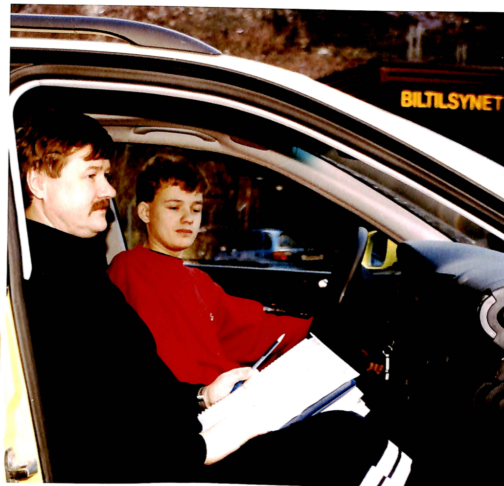
Sunndalsøra var som kjent tidligere et eget biltilsynsdistrikt. Stasjonen er nå ingen selvstendig enhet, men tilhører Kristiansund trafikkdistrikt. I 1997 ble det utstedt 883 førerkort og registrert 2 824 kjøretøy.