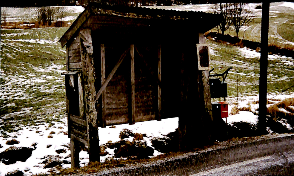
Melkerampa i Krekvika i Eide har hatt en viktig, men muligens en noe tvilsom betydning helt fra den ble bygd på 50-tallet. Nå opplever den en renessanse.