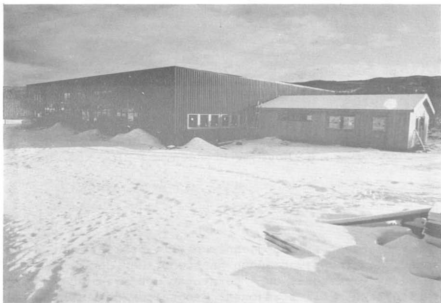
Den nye vegstasjonen på Geilo.