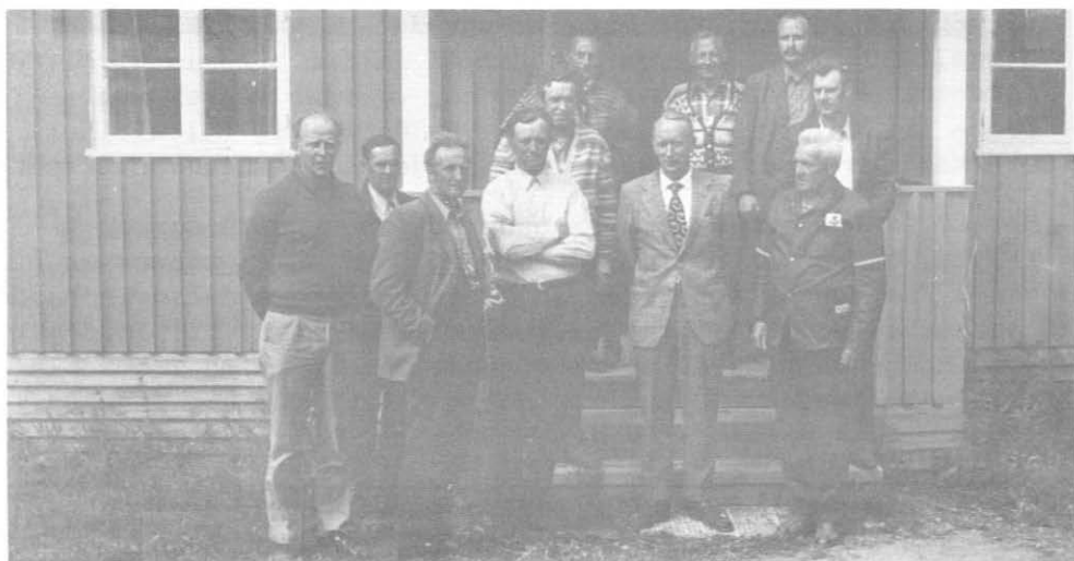
Noen av kursdeltakerne.