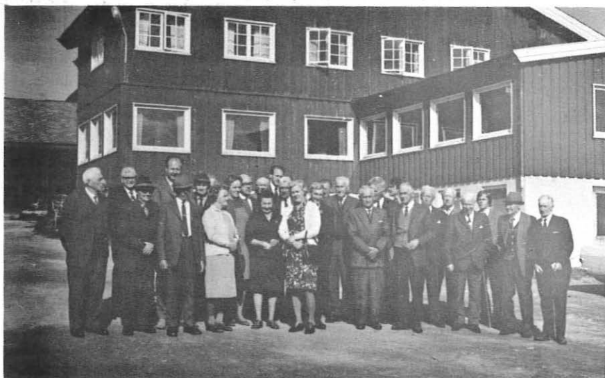
Bildet viser deltakerne fra "Hallingturen".

Onsdag den 12. september var det så "Hallingenes" tur til å dra avgårde. Turen startet på Gol og gikk over Hemsedal - Lykkja til Oset Hotell hvor det var spisepause. Turen gikk så videre ned Hallingdal til Nesbyen og Gulsvik hvor de nye bruanleggene ble besiktiget. Middag ble servert på Nor Kro. Ialt var det 25 pensjonister som deltok.