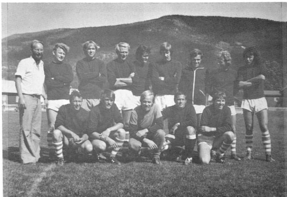
Det seirende lag: Sogn og Fjordane.

Finalen husker vi fra Buskerud ikke noe særlig fra. Vi tapte bare 3-2, så årets nest beste veglag heter altså Buskerud.