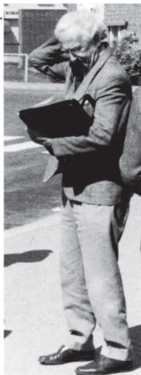
Det kan se ut som om reiselederen har visse problemer.

Etter en snartur på den nye Hvåra bru, som ble åpnet i vår, endte turen på Fossekroa ved Brufoss. Her ble det servert middag. De ansatte i driften var også invitert til middagen og det etterfølgende orienteringsmøtet.