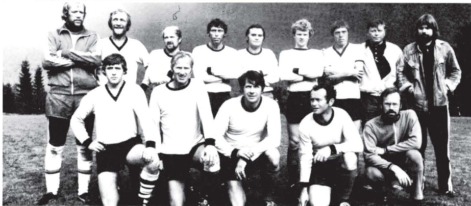
Her er laget som eurobret 2. plassen