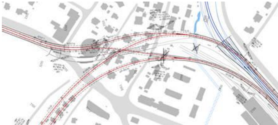
Figur 0-1: Innføring Majorstuen vest.

Hele strekningen som ligger parallelt med Slemdalsveien og Valkyriegata kan gjennomføres med full drift på T-banen. Øst for stasjonen bygges også tilknytningen av ny sentrumstunnel helt ferdig, slik at det i øst bare gjenstår sammenkobling av eksisterende Fellestunnel til stasjonen mens banen må være stengt. Sammenkobling i vest og øst gjøres samtidig. I øst er det særlig sammenkobling av eksisterende Smestadbane som er tidkrevende da en ganske lang strekning må bygges ny i eksisterende trase. Samlet er det anslått en stenging av banen i fire måneder i fase 4.