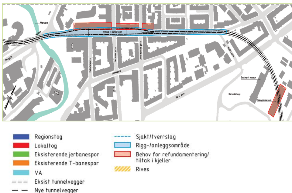
Figur 0-1: Anleggsgjennomføring Trondheimsveien, T-bane, K2.

Trikketrafikken til Grünerløkka som passerer Nybrua vil kun påvirkes i korte perioder. Det antas at Nybrua ikke blir påvirket av arbeidet, men at dette krever noen sikkerhetstiltak. Det er knyttet stor usikkerhet til skader på nærliggende bebyggelse langs Trondheimsveien grunnet gammel/dårlig bygningsfundament. Det er lagt opp til at arbeidet kan deles opp i mindre strekninger slik at anleggsperioden begrenses/redueres per delstrekning.