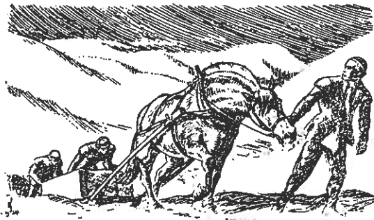
Sten fra Danmark til stiftsstøtten transporteres over Filefjell. (Efter „Aftenposten“.)

Ved omlegning av veien i 1830—40 årene blev Stiftsstøtten, som den kalles, flyttet 1) .