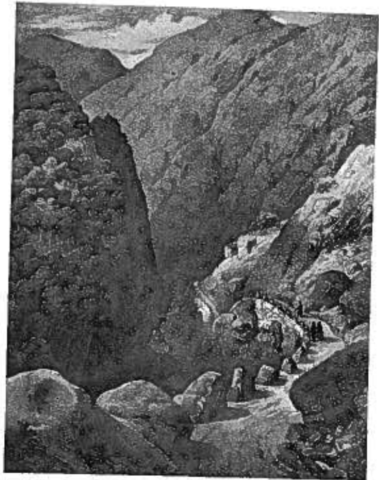
Gallerne i Lærdal. Den gamle vei.

«Til veiarbeidet maa der af de omgrænsende skove uden vederlag tages det ubetydelige træfang, som behøves til smaa klappebroer eller til rækværk i klever og bakkeheld; men dersom der i et aar af nogens skov