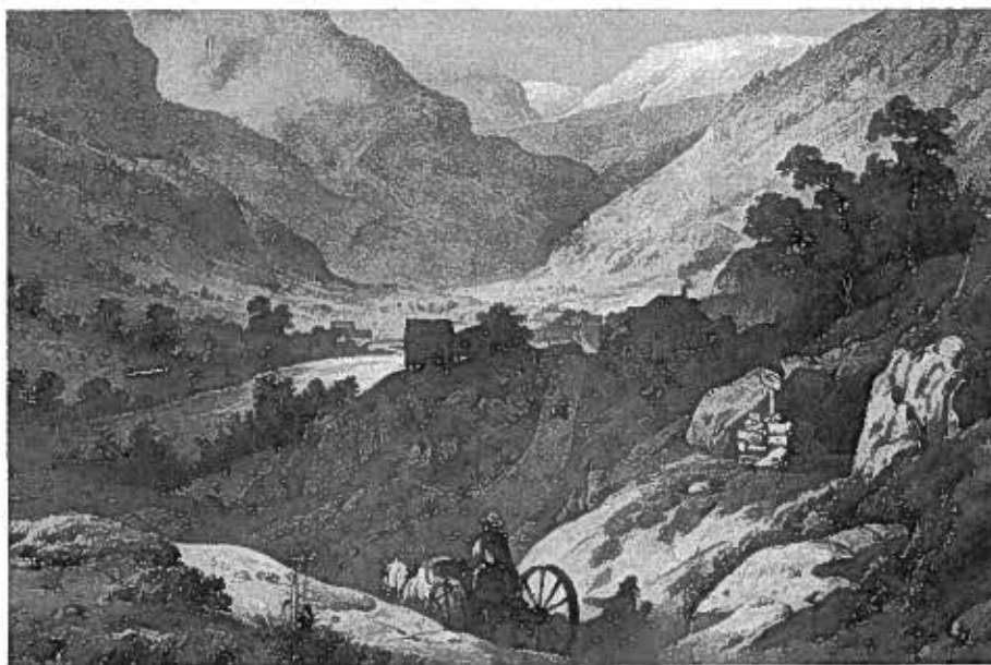
Parti mellem Vindhellen og Gallerne.